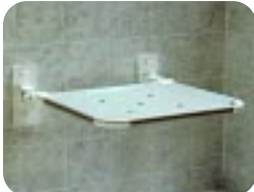
Duschklappsitz mit Kunststoffbespannung W17