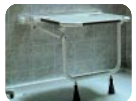
Klappsitz mit Kunststoffbespannung W18