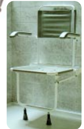
Nylonverstärkter Kunststoffstuhl mit Arm- und Rückenstütze W19