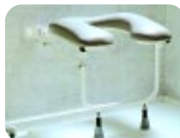
Klappsitz mit gepolsterter Hufeisenöffnung W13LSH/S (klein) W13LMH/S (mittel) W13LLH/S (groß)