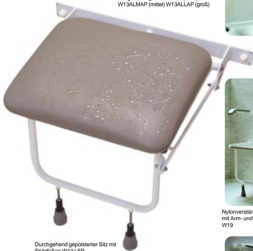
Durchgehend gepolsterter Sitz mit Stützfüßen W13 LFP