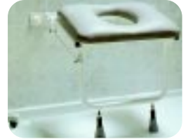
Gepolsterter Duschklappsitz mit ovaler Pflegeöffnung W13ALSAP (klein) W13ALMAP (mittel) W13ALLAP (groß)