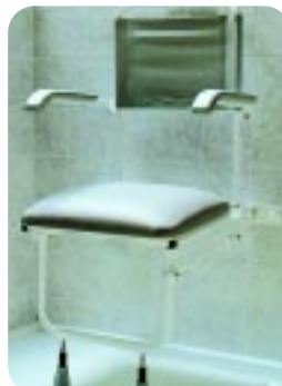
Durchgehend gepolsterter Sitz mit Armstützen und Stützfüßen W19PFP Klappsitz mit gepolsterter Hufeisenöffnung W19PSH/S (klein) W19PMH/S (mittel) W19PLH/S (groß) Gepolsterter Duschklappsitz mit ovaler Pflegeöffnung W19PSAP (klein) W19PMAP (mittel) W19PLAP (groß)