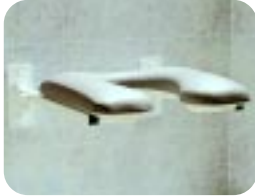
Klappsitze mit gepolsterter Hufeisenöffnung W13SH/S (klein) W13MH/S (mittel) W13LH/S (groß)