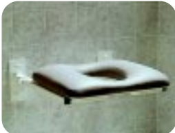
Gepolsterter Duschklappsitz mit ovaler Pflegeöffnung W13SAP (klein) W13MAP (mittel) W13LAP (groß)