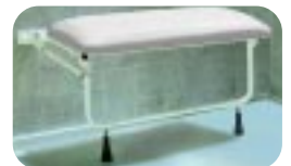
Extrabreiter, durchgehend gepolsterter Klappsitz W14LFP

Bequem und hygienisch, helfen die Chiltern Invadex Duschklappsitze beim Erreichen größerer Selbständigkeit und Sicherheit beim Duschen.