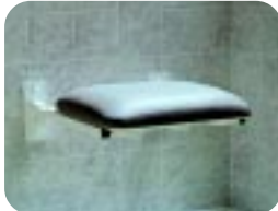
Gepolsterter Duschklappsitz, durchgehend gepolstert W13FP